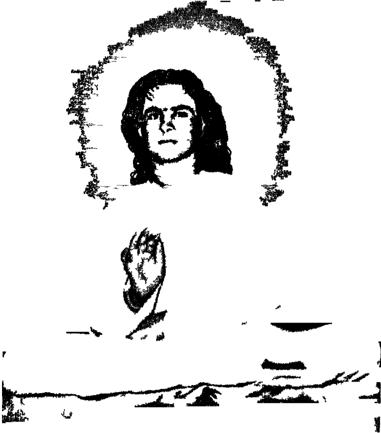
श्री श्री १००८ हैडाखानवाले बाबा